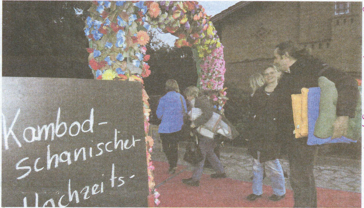
Über einen roten Teppich und durch einen kambodschanischen Hochzeitsbogen schritten die Kinofans auf dem Arche-Hof zur DVD-Premiere. Es handelte sich nach Angaben des Produktionsleiters Martin Rohrbeck um die heimliche Premiere.

Mit dem Open-Air-Kino in Kneese setzte das Lebenshilfswerk Hagenow gGmbH seine Veranstaltungsreihe „Begegnungen“ fort. Ziel ist es, den Integrationsse-