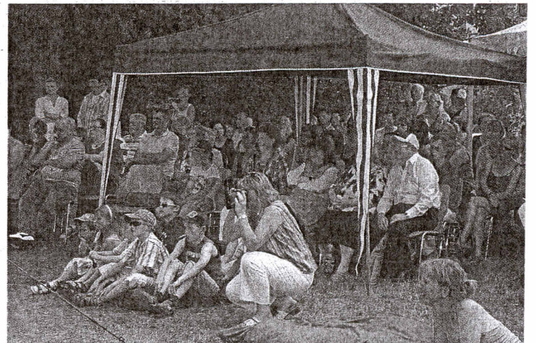
Interessiert verfolgten die vielen Zuschauer im Sinnesgarten die Darbietungen.

zu Hause sind. Mit dabei ist auch immer die Hagenower Dörpschaft, deren Mitglieder schon seit Jahren einen ganz besonderen Kontakt zu den behinderten Menschen des Lebenshilfswerkes pflegen und bei den alljährlichen Veranstaltungen immer wieder gern gesehene Gäste sind.