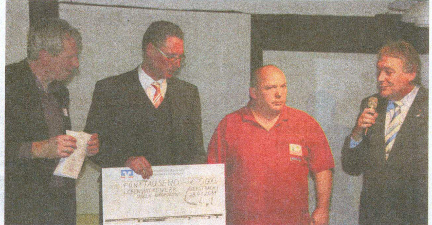
Spendenübergabe der Eckernförder Bank an Vertreter des Lebenshilfswerkes.